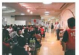
すべての拠点の最後となった、大東拠点の閉会式(24日)