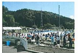
ボランティアメンバーを合わせた200人以上の大きな輪の輪ができました。