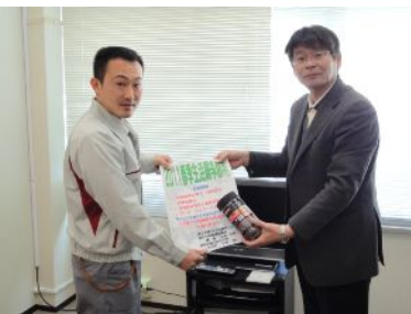
J-POWERグループユニオン

2月22日(火)に北魚沼支部長・事務局長・コーディネーターで6単組を訪問して、11春闘勝利の檄紙と激励物資を手渡し、各単組の景況や春闘の取組状況について情報と意見交換をしてきました。