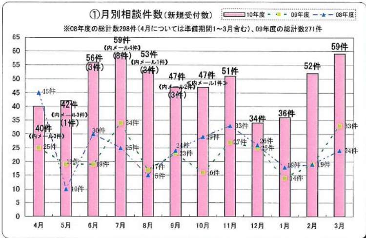
【10'4月~11'3月 LSC相談集約】 相談合計数576件(内みつけ事務所18件) ※全てのグラフ共通、( )内は見附事務所に寄せられた件数