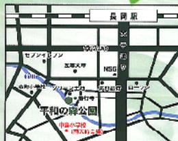
地図: 原 真知子