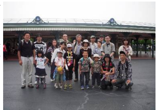
2012年6月のディズニーリゾートバスツアー