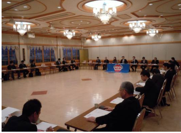
たてが「また、さあがテ共などのンタ告組の常規非拡大、