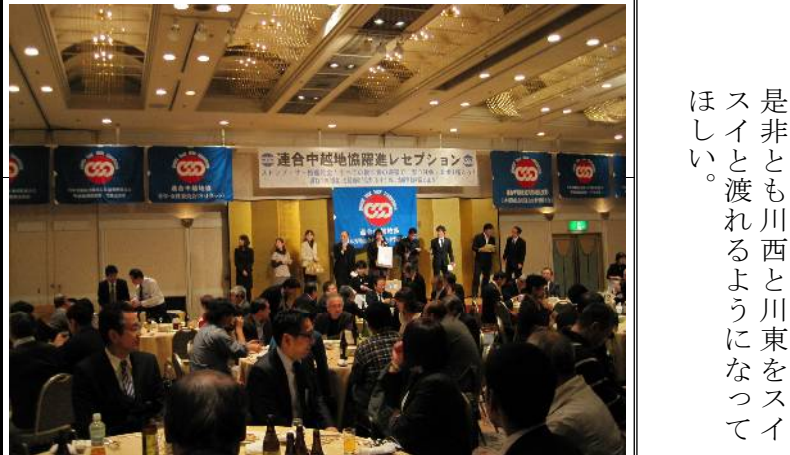
質上げ・一時金情報、活動予定・紹介・報告、地域よもやま情報、連合中越のホームページは http://tyuuetu.net/ 連合中越のメールアドレスは rengo.c@topaz.ocn.ne.jp