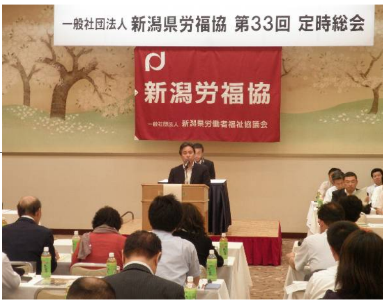
一般社団法人新潟県労福協 第33回 定時総会

そのほか、昨年実施したワークライフバランスのワークライフプログラムは第3ブロックの上越市で開催することが報告され、第2ブロックの長岡地区はワークライフセミナーを実施することになった。因みに長岡地区労福協におけるワークライフセミナーは9月6日(土)午後10時から12時30分まで、