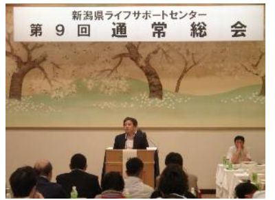
新潟県ライフサポートセンター 第9回通常総会

果などの報告があった。続いて審議事項では、平和関係を中心に審議し、平和の森コンサート、非核平和都市宣言市民の集いや平和フォーラム、各支部平和関係事業について決定した。また、次年度自治体要望への産別構成組織からの要望意見状況や昨年度実施したワークライフプログラムに変わるワークライ