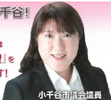
小千谷市議会議員