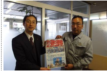
写真は上から 栄工舎、JPGU、中村バルブです。