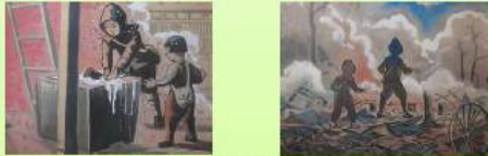
長岡空襲紙しばい「思い出の記」