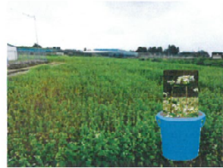
・7/30種蒔、8/1二葉が出た ・8/29 つえの写真。花が咲いたよ さて、皆さんのバケツはどう?