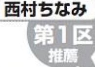
西村ちなみ 第1区 推薦

経歴:1967年生。三条高校・新潟大学卒。タイ王国・英国へ留学。新潟大学大学院修士課程修了。新潟産業大、敬和学園大などで非常勤講師をした後、新潟国際ボランティアセンター事務局長。1999年4月に県議会議員に当選。2003年11月の衆院選で初当選。外務大臣政務官を歴任