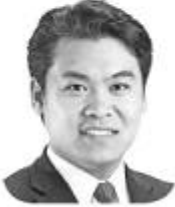
わしお英一郎 第2区 推薦

経歴:1977年生。新潟高校・東京大学卒。新日本監査法人に勤務後個人事務所を設立。公認会計士、税理士、行政書士。2005年衆院選に出馬するも次点であったが、北陸信越ブロックで当選。2009年衆院選では新潟2区で議席を獲得。2012年衆院選では北信越ブロックで当選。元農林水産大臣政務官。