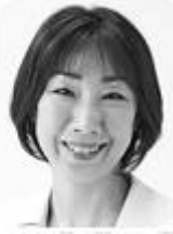
菊田まきこ 第4区 推薦

経歴:1969年生。加茂高校卒・中国黒龍江大学留学。全国最年少(25歳)で加茂市議初当選し、2期連続トップ当選。2000年衆院選で惜敗するも、2003年衆議院議員初当選。外務大臣政務官、民主党副幹事長、政策調査会副会長を歴任