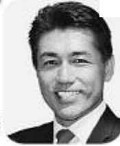
黒岩たかひろ 第3区 推薦

経歴:1966年生。六日町高校卒・東京大学中退。勤労産業研究財団、新潟地域福祉研究所代表などを経て、2002年4月参院補選で初当選。2007年参院選では民主党2人当選には及ばず僅差で惜敗するも、2009年8月の第45回衆院選では、新潟県最高得票率(66%・154,985票)で、新潟3区から初当選するも2012年12月の第46回衆院選で惜敗。元法務大臣政務官を歴任。