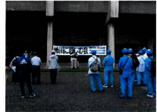
*清掃活動と史跡探訪の様子です。