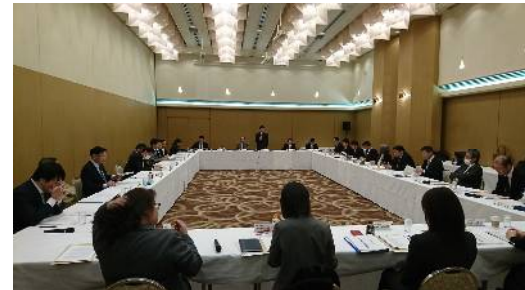
生活闘争基本構想などが協議決定された。

牧野会長は開催の挨拶で、桜を見る会等の国政と20春季生活闘争等について触れた。会議では、女性委員会選出執行委員、青年委員会選出執行委員、2020(21)年度連合新潟専門委員会の設置等や副会長の地協担当制等や2020春季