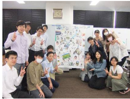
写真は、今年採用された新採用組合員が、労働講座に向けて作った壁新聞です

人員増、超過勤務の縮減などの労働条件の改善はもとより、地域医療を守る取り組みも進めています。