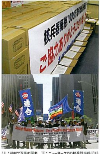
(上:約877万筆の署名 下:ニューヨークでの核兵器廃絶デモ)

2010年に開催されるNPT(核拡散防止条約)再検討会議に向けて「核兵器廃絶を求める署名」を世界中で行っています。いただいた署名は、内閣総理大臣および国連へ提出します。