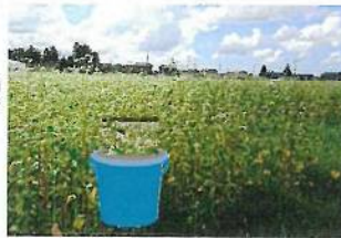
・9/9の写真です。さて、皆さんのバケツはどう?

参加費 大人100円、子供は無料 (豚汁付予定だよ) 申込締切 10月5日(火) ※連合中越地域協議会(TEL0258-86-0111)まで 持ち物 おにぎり (お椀・箸は事務局用意) その他 汚れてもよい服装で来てね (マスク、長靴、タオル等は各自で用意) ※感染状況によっては変更や中止があり得ます