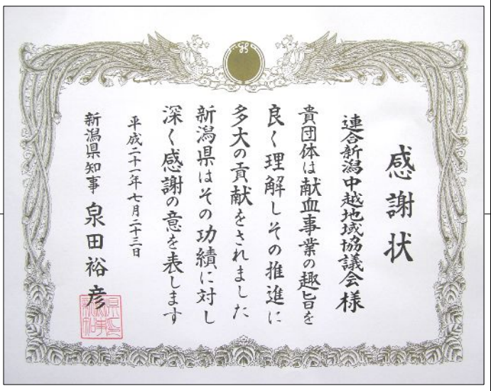
授与された新潟県知事感謝状

新潟県知事感謝状授与 献血活動に功労者表彰 新潟県自治会館別館において、平成21年度新潟県献血功労者表彰式が7月23日(木)行われ、連合中越地協に小熊副知事から新潟県知事感謝状と記念品が贈呈された。連合中越の表彰は、平成16年7月日本赤十字社新潟県支部長感謝状授与以来2年度目。これも、1998年から継続の長岡地区メーデー「ほのぼのの献血事業」に対するもの。需要期の血液確保が期待されている。他に厚生労働大臣表彰2団体、厚生労働大臣感謝状6団体、新潟県知事感謝状16団体、日本赤十字社新潟県支部長感謝状5団体、2個人が表彰された。