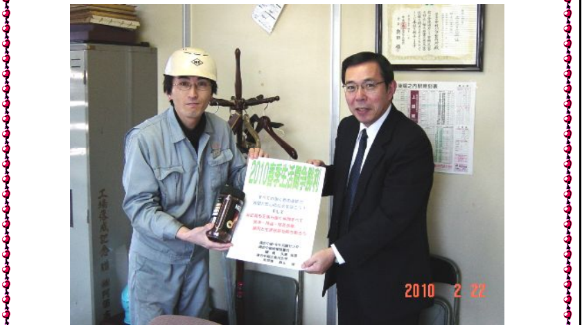
中村バルブ労組へ

2月22日(月)に北魚沼支部長、事務局長、コーディネーターで9単組を訪問して、10春闘勝利の激紙と激励物資を手渡し、各単組の景況や春闘の取組状況などについて情報と意見交換を行ってきました。帰り際、ある単組からは要求書は提出したが、不景気の波を受け、良い回答は期待できそうにもないとの生の声も聞けて、とにかく大変厳しい闘いとなるが産別を中心とし団結をきっちり固めて「春闘を頑張りましょう!」と、ともに闘っていくことを確認して職場を後にしました。