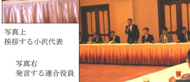
写真上 挨拶する小沢代表 写真右 発言する連合役員

六月九日(月)十七時から新潟市・東映ホテルにて、連合新潟四役と各地協代表が、民主党の小沢代表等を招いた意見交換会が実施された。地域の忌憚のない声を聴きたいと、民主党と連合本部の要請もあり、地協代表の参加となった。 意見交換は定刻に開始され、冒頭、江花会長より挨拶。政権交代に向けた民主党の強い運動と、地域を疲弊させない国づくりなどが提起され、小沢代表からも「しがらみのない民主党が政権を奪取しない限り、中央官僚支配体制は崩せない。民主党の弱さもあるが、地域では連合の働く仲間との連携こそが重要。」と挨拶が述べられた。 続く意見交換では、衆議院選挙における与野党逆転の展望や、政