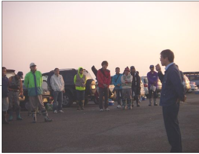
たてがが飲に大し集リメリば軽剣も中いいのあ たてがが飲に大し集リメリば軽剣も中いいのあ たてがが飲に大し集リメリば軽剣も中いいのあ

サラリーマン川柳(石の上三年たてば次の石)(何故だろう私がいないと上手いく)(運が悪い人で成り立つ宝くじ)(食べて糖飲んで血圧吸えばガン)