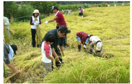
昨年の稲刈りの様子

当日は、9時40分に開会。四隅を手刈りした後、春に持ち帰ったバケツ稲コンテストを実施する。お米に関するクイズやポン菓子も作るため、子どもが楽しめる内容の企画となっている。