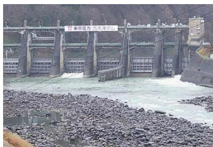
信濃川発電所(津南町)④、西大滝ダム(長野県飯山市)⑤

今年の12月には、当社として48年ぶりとなる水路式の水力発電所が運転開始の予定です。(出力は1000kWと小さいですが)水力発電は、地球温暖化の原因とも言われるCO2をほとんど出さない、環境にやさしいクリーンエネルギーです。今後も電力の安定供給に努めていきますのでご理解・ご協力をお願いいたします。