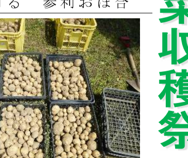
収穫したジャガイモを土産に持ち帰りました。