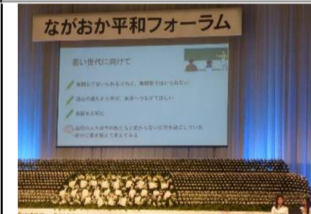
ながおか平和フォーラム

第1部では、長岡市の大学生二人による記念講演「被爆の実相と平和な未来のために」が行われました。講師の二人は、核兵器廃絶長崎連絡協議会が主催する人材育成プロジェクトのナガサキ・ユース代表団の9期生です。戦後78年、長岡や広島などの被爆地、そして長岡などの空襲被災地では、自らの体験を語り継ぐ体験者が年々減少し、これからどのように次の世代へ伝えて