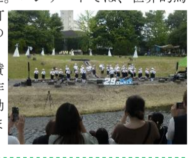
平和の森公園平和像前で

このコンサートに連合中越は協賛団体として参加しており、準備作業、当日の運営に労組から多くの動員者の協力を得て、運営に協力しました。