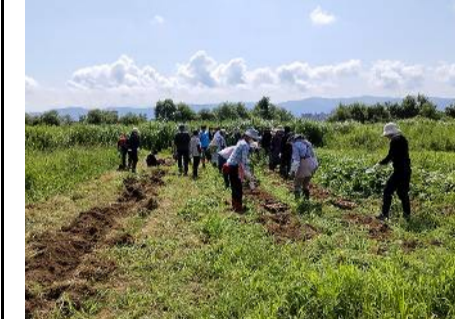
NPO法人UNE・連合中越・フードバンクながおか

式典では、広島派遣中学生に小学生が折った鶴が依託され、最後に広島派遣中学生による「平和の誓い」を発表し終えました。